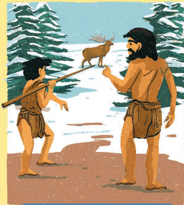
Protoistorie ~ Un tată își învață fiul să vâneze

În acea perioadă, băieții și fetele trebuiau pregătiți pentru supraviețuire: învățau să vâneze, să culeagă și să lucreze pământul (după ce a apărut agricultura). După ce dobândeau aceste cunoștințe, puteau deja să participe la activitățile grupului lor, lucru care uneori era simbolizat printr-o ceremonie.